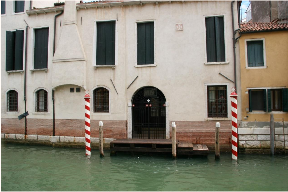
Porta d'acqua di Palazzo Malta su Rio della Pietà (Sant'Antonin)